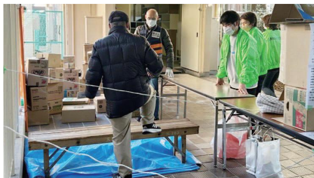
足元が悪いところを歩く体験