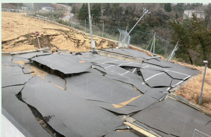
主要道路であるのと里山海道

1月28日(日)から2月4日(日)までの間、巨大地震の爪痕が残る輪島市に、大阪府の災害支援チームの一員として、輪島中学校の避難所運営支援に参加してまいりました。