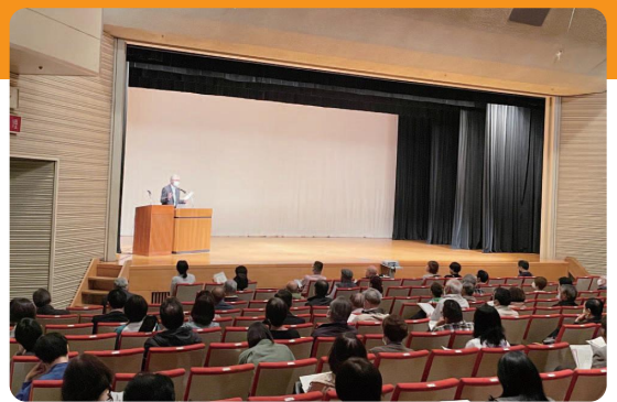
昨年の自治会長説明会の様子

詳細につきましては、3月15日(金)発送の市からの自治会長宛送付文書をご参照ください。