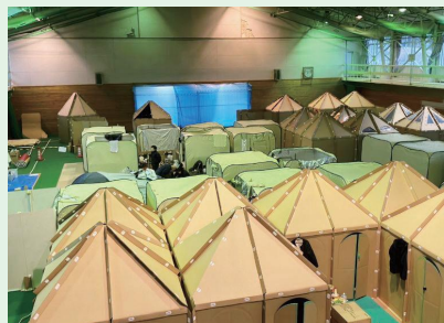
輪島中学校の体育館の段ボールハウス

皆さんも今回の能登半島地震を他人事としてとらえることなく、自助・共助として平素から非常食や飲料水などをご家庭で備蓄するとともに、いざ発災したときには隣近所で助け合えるよう地域コミュニティとしてとるべき行動をイメージしていただき、来るべき時に備えておくことが重要だと思いました。