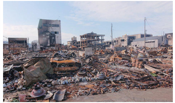
火災で焼失した輪島市の朝市通り

茨木市では、令和6年1月1日に発生した令和6年能登半島地震の被災地に対し、大阪府や他市町村と連携のもと、緊急消防援助隊や応急危険度判定士をはじめ、給水や避難所運営の支援のための職員派遣などを行っています。また、市営住宅の提供や罹災証明書の申請支援、介護サービス利用料の減免など、茨木市への避難者等を対象とした支援も行っています。今回、避難所運営支援のため石川県輪島市に派遣されました茨木市危機管理課職員にお話を伺いましたので紹介します。