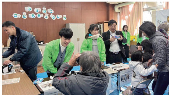
VRゴーグルを使った防災体験の様子

活動にご協力いただいた地域の方からは、「訓練当日は、30・40代の家族連れが参加者の半数を占め、目標を達成することが出来ました。『楽しかった』との声が多数あり、これからの防災訓練の開催方法を考えさせられる行事となった」というお声がありました。