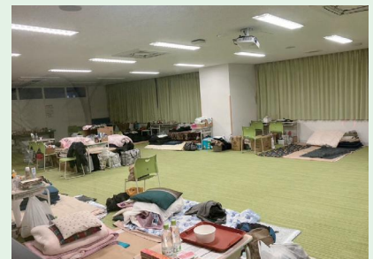
輪島中学校の教室での避難所生活